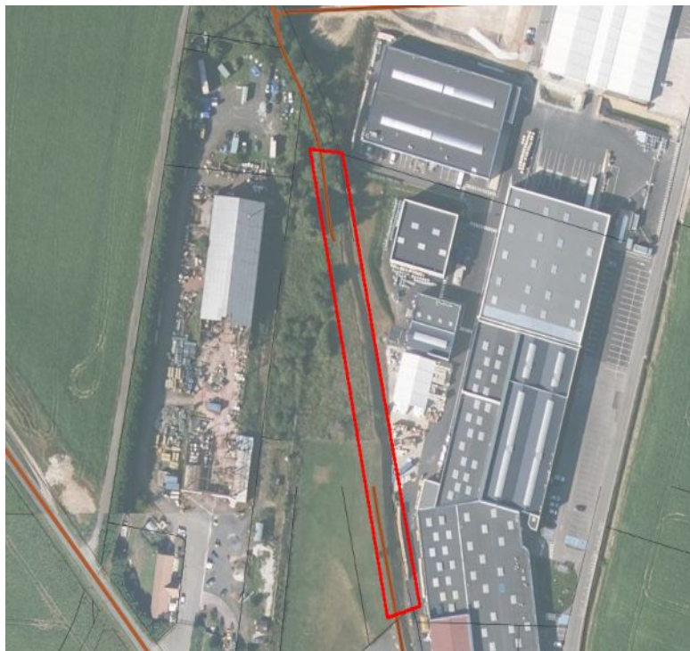
Implantation aérienne du projet

Le chemin du Blandy est situé hors l'agglomération à l'intérieur de la zone industrielle définie entre la Sente du Blandy et la rue de la Croix Blanche en direction de Nanteuil-le-Haudouin. Le projet d'aliénation concerne la portion comprise entre les parcelles ZC52 et ZC54.