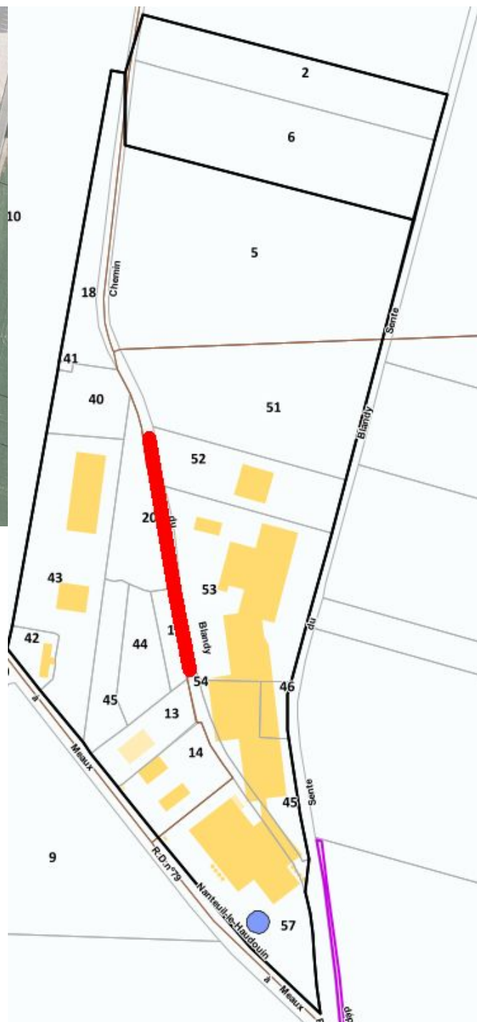
Implantation cadastrale du projet